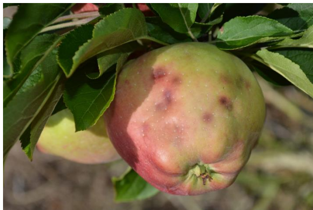
Ознаки пошкодження рослин